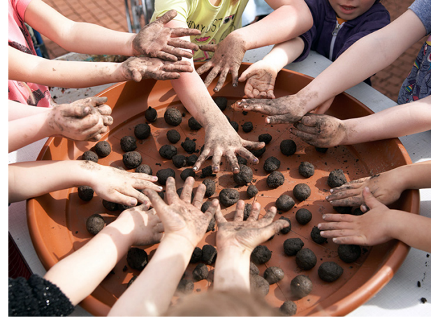
Gemeinsames Tun im Schulgelände