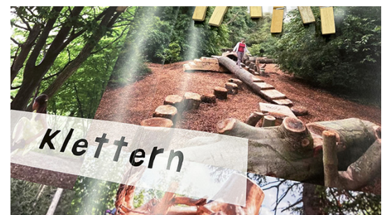
Klimafreundliches Schulgelände